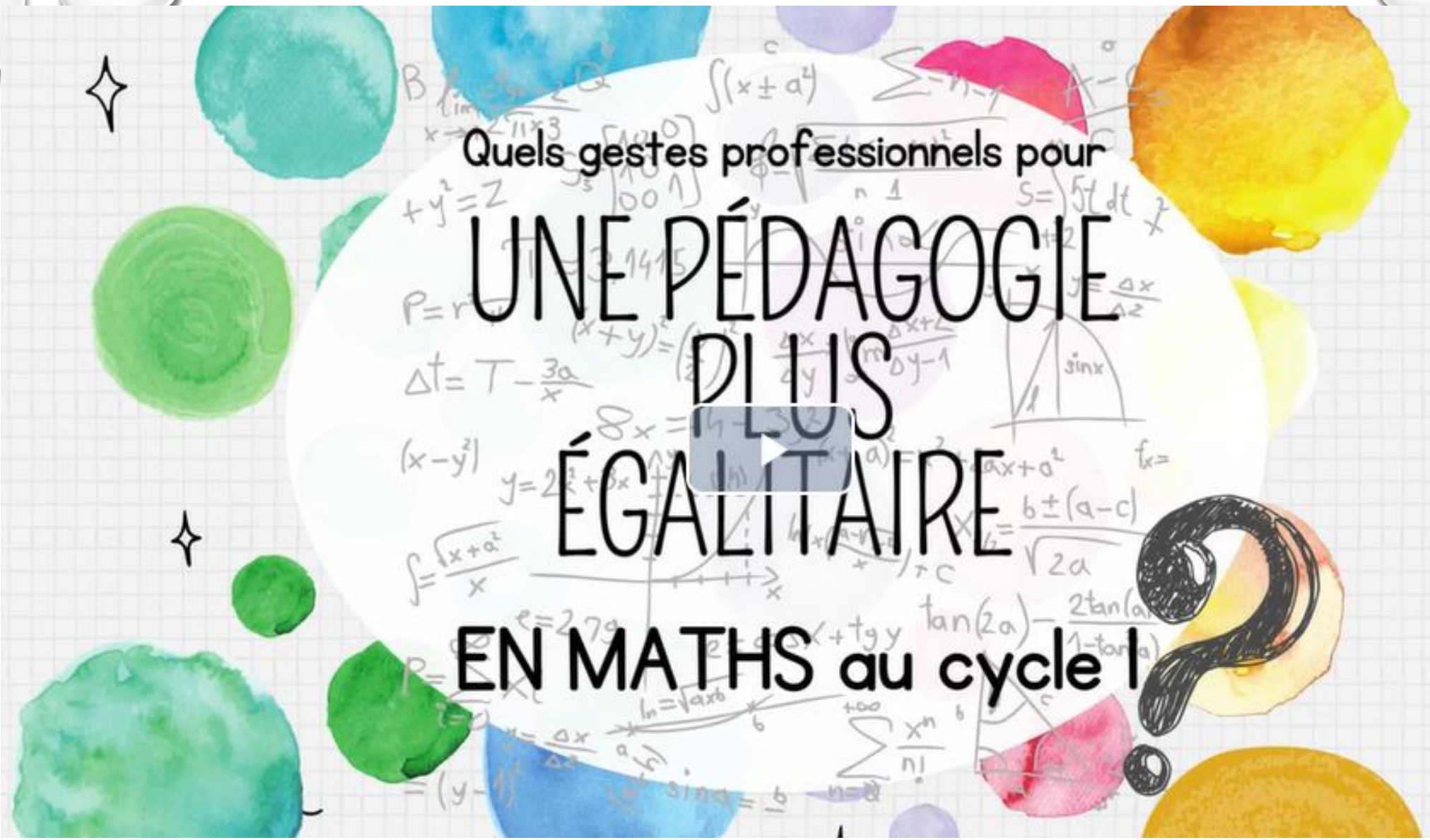
vidéo Pôle maternelle Académie de Dordogne