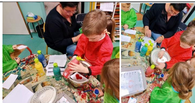
L'essoreuse à salade