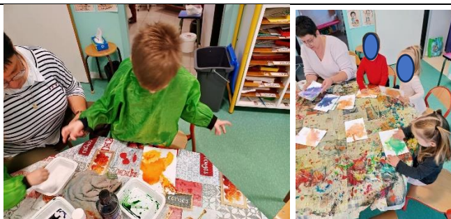
Encre et sel