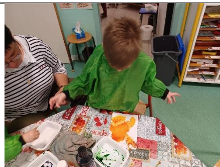
Pipette + eau